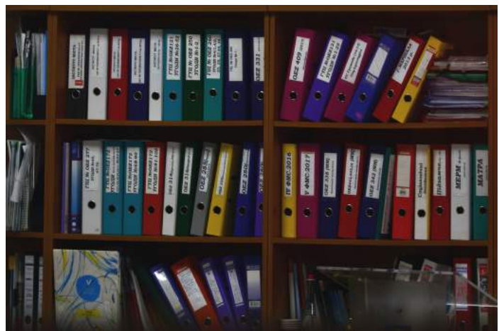
Det kan koste dyrt i tid og ressourcer med meget bureaukrati i foreningerne.

Han henviser blandt andet til kulturministeriets undersøgelse om benspænd, som viste, at halvdelen af bestyrelsesmedlemmer overvejer stoppe - og halvdelen af dem henviste til det administrative som den bærende grund.