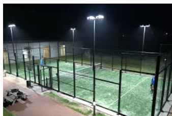
Eksempel på lyssætning på en padelbane