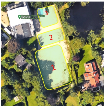
Principiel placering på arealet