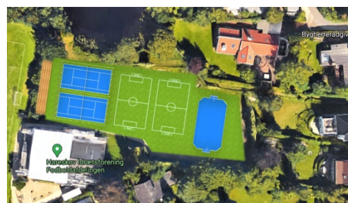
Fra nedslidt grusbane til spændende og fællesskabende motionsarena

Forslaget til revitalisering af grusbanen er et ambitiøst, men også realistisk forslag til en fremtidig udnyttelse af arealet, der både tilgodeser den organiserede foreningsidræt og de uformelle aktiviteter og fællesskaber udenfor foreningerne.