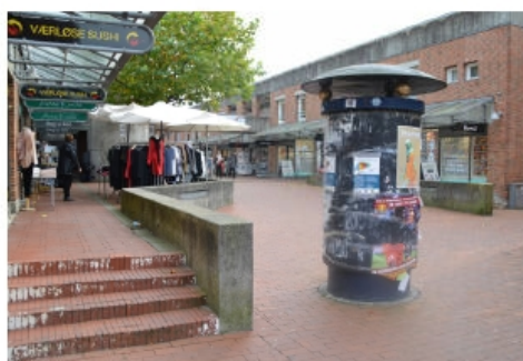
Billedet viser de eksisterende forhold

”Markedsrotunden” har været en del af et projekt, som man politisk besluttede ikke at gå videre med . Projektets kostede 400.000. I prisen regnede man med, foruden flytning af selve rotunden, at nedrive dele af betonstøttemurene i området, til gengæld for en opmuring af trappe med mulighed for siddepladser. Nedenstående foto er fra bilaget til dagsordenspunktet, hvor man fravalgte projektet.