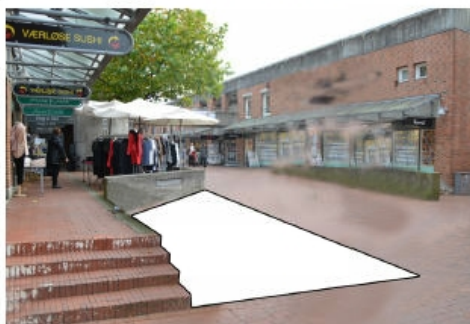
Billedet viser det areal der skal ændres samt, at plakatøjlen fjernes og betonmuren fjernes. På arealet etableres der trapper og opholdsmuligheder.

Centerforeningen ønsker, at der etableres en bänk lignende med bænken, som blev etableret ved legepladsen. Denne bänk kostede ca. 94.000 kr. og var 14 m lang.