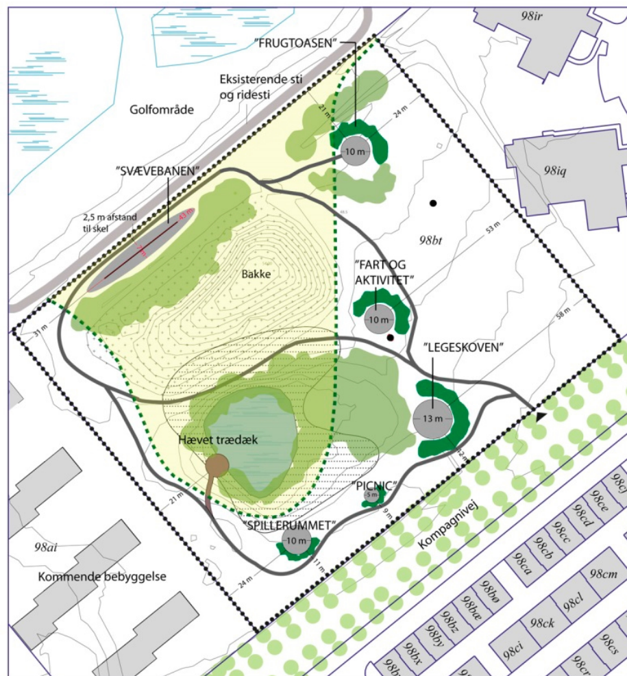
Illustration af disponering af området s. 16.